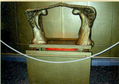
Modell der Bundeslade (siehe auch S. 85)

Nachkommen Aarons: Aaron gilt als der erste Hohepriester. Von ihm stammt die gesamte jüdische Priesterschaft ab.