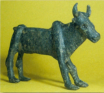
17 cm lange Stierfigur aus Bronze aus dem 12. Jahrhundert v. Chr. In dieser Größe kann man sich auch das »Goldene Kalb« vorstellen.

Kalb: Der Jungstier ist ein Symbol für Kraft und Stärke. Bei vielen Völkern in der Umgebung Israels verehrte man damals Stiergötter. In Ägypten stand der Stiergott Apis für Fruchtbarkeit. Die Bibel gebraucht mit dem Begriff »Kalb« bewusst ein abwertendes Wort für das Bild des Stiergottes, das Aaron anfertigte.