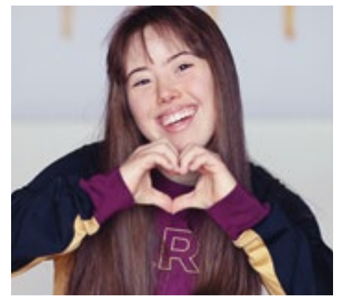
▼ Ylana February · Février · Febbraio 1 2 3 4 5 6 7 8 9 10 11 12 13 14 15 16 17 18 19 20 21 22 23 24 25 26 27 28 29