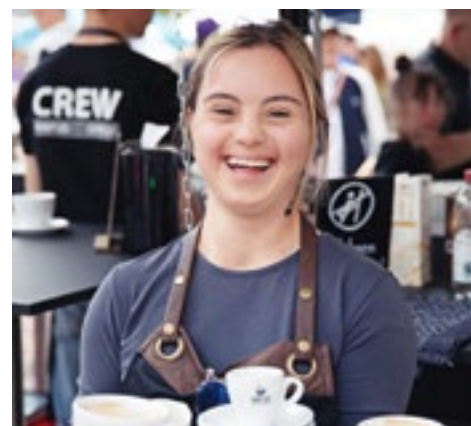
▼ Odine September · Settembre · Settembre 1 2 3 4 5 6 7 8 9 10 11 12 13 14 15 16 17 18 19 20 21 22 23 24 25 26 27 28 29 30