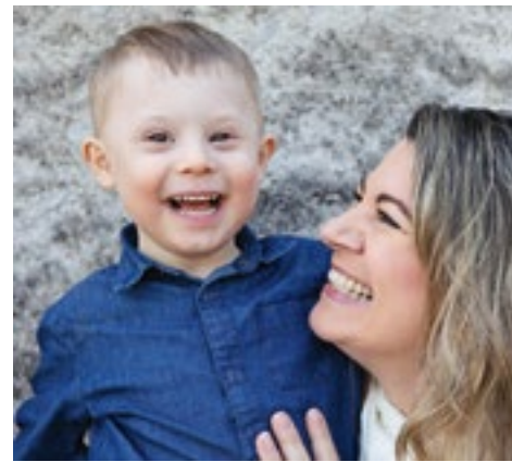
▼ Maria May · Mai · Maggio 1 2 3 4 5 6 7 8 9 10 11 12 13 14 15 16 17 18 19 20 21 22 23 24 25 26 27 28 29 30 31